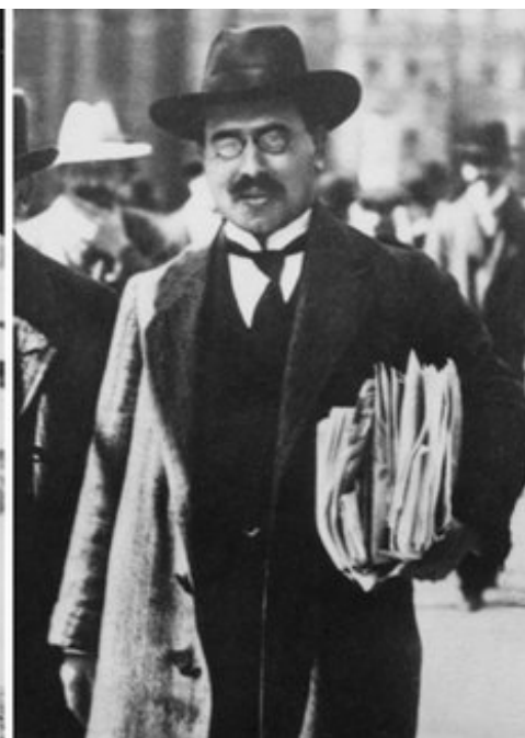
Luxemburg en Liebknecht

kapitalisme. In sommige gebieden namen lokale SPD-leiders het initiatief om raden op te zetten. Ze deden dit om er zeker van te zijn dat zij de controle erover hadden. De revolutie bracht eisen voort zoals de 'socialisatie' (nationalisatie onder democratische controle). Om deze eis schijnbaar in te willigen, maar eigenlijk vooral om het op een zijspoor te zetten, besloot de RdV midden november om een comité op te zetten dat moest nagaan welke sectoren 'rijp' waren voor socialisatie. Het is overbodig om te zeggen dat hier niets van in huis kwam. Toen het eerste nationale congres van Arbeiders- en Soldatenraden in december begon, verklaarde Ebert dat "de winnende arbeidersklasse geen klassenbewind zal vestigen."