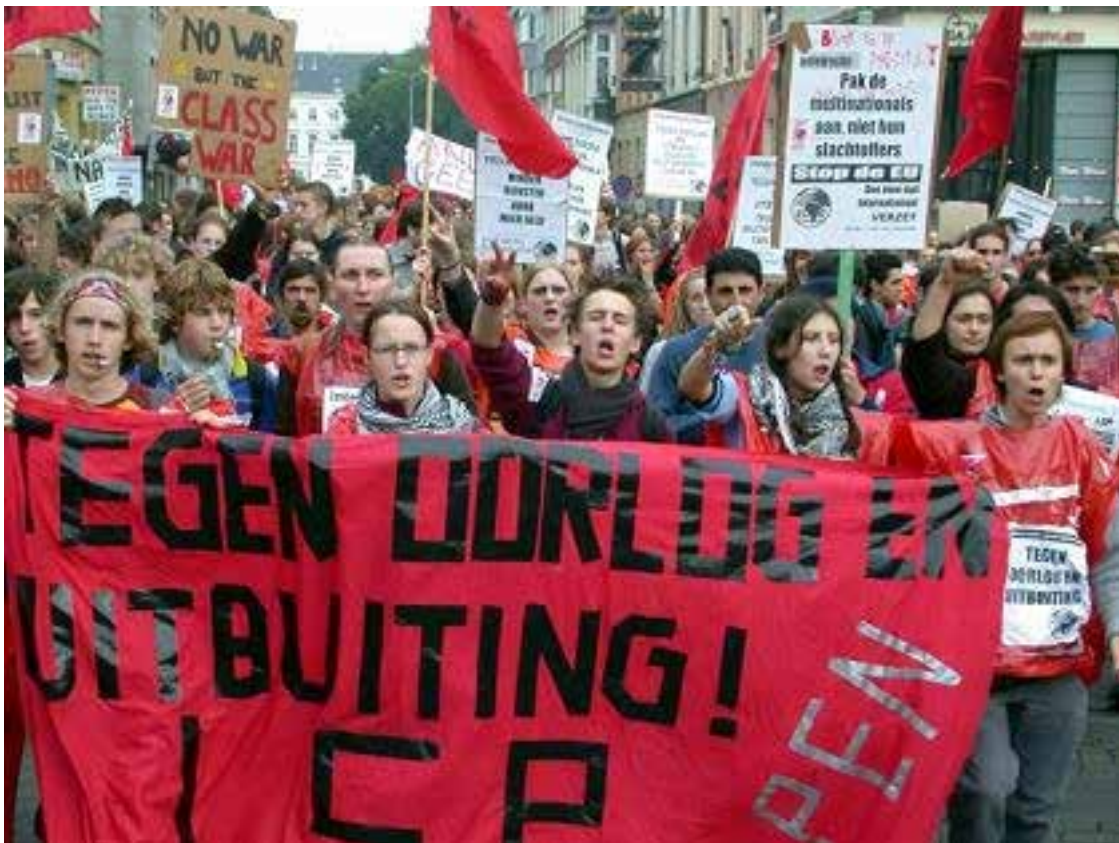
2001. Betoging tegen een EU-top in Gent.

Het zou moeten volstaan om te wijzen op wat de EU betekent op vlak van privatiseringen, denk maar aan de privatiseringen in Griekenland, om op basis van een vakbondsstandpunt tegen een Remain-stem te pleiten. De EU verplichtte Griekenland om maar liefst 71.000 eigendommen en bedrijven te verkopen, waaronder de regionale luchthavens. Het idee van een 'progressieve' EU is voor elke werkende Griek tegengesteld aan de eigen