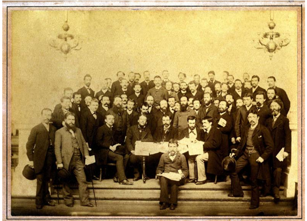
De afgevaardigden op het eerste BWP congres in 1885.

In 1985 werd het 100-jarige bestaan de Belgische Werkliedenpartij (BWP) uitgebreid gevierd. In Vonk nummer 58, maart-april 1985, schreef François Bliki een dossier over het ontstaan en de eerste stappen van de BWP. De opstelling van de burgerij tegenover de eerste arbeidersorganisaties komt vandaag overigens bijzonder bekend en actueel voor.